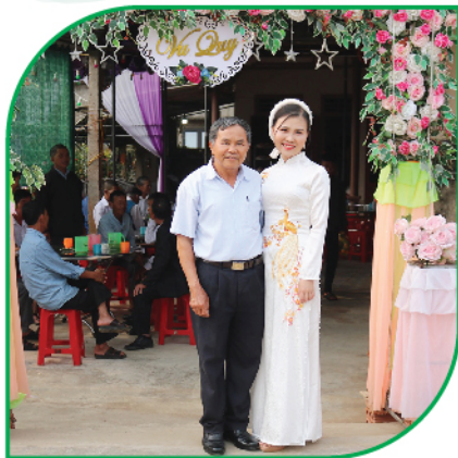
"Chỉ cần có cơ hội chữa bệnh cho con thì bán hết nhà cửa cha vẫn bán" .

Tôi còn bị đi ngoài, sốt và nôn nhiều lắm. Tôi nôn ra cả máu, miệng họng đều bị loét, không ăn uống được và phải truyền dinh dưỡng gần 1 tháng. Dù mệt nhưng tôi vẫn đứng dậy, tự vệ sinh cá nhân để cha mẹ bớt lo lắng. Những ngày khó khăn nhất cũng qua đi, tôi được về nhà và chỉ cần vào Viện kiểm tra định kỳ.