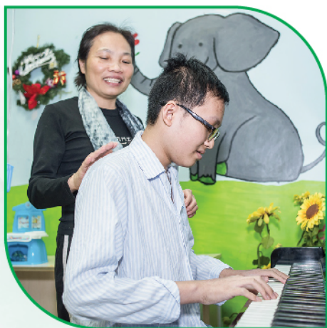
Bản nhạc dành tặng mẹ, em đã tập trong 2 ngày, nhưng mỗi ngày em chỉ tập được chưa đầy 2 tiếng vì tay em còn gắn kim truyền.