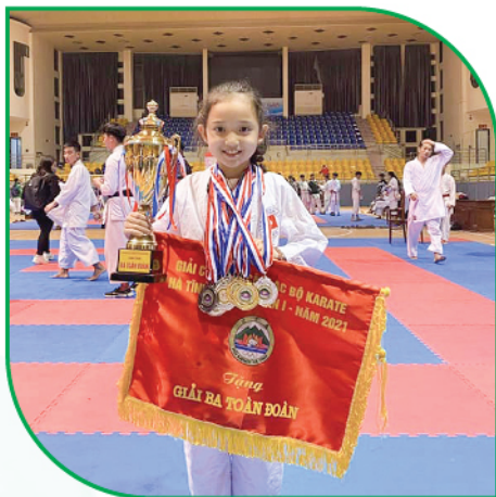
Con luôn hết mình với các hoạt động mà con yêu thích.