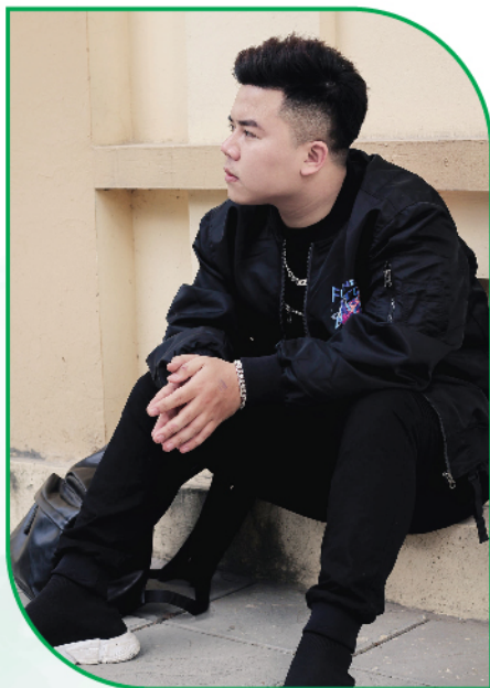
“Em coi ung thư như một bệnh cúm”.

Thua thiệt về sức khỏe khiến Nguyên gặp khó khăn khi đi xin việc cũng như tìm được một công việc ổn định. Nỗi thất vọng về bản thân đã làm tâm trạng của anh đi xuống nặng nề.