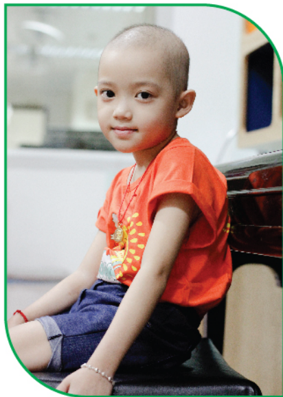
Con là đóa hoa hướng dương luôn vươn mình về phía mặt trời

Đó là niềm an ủi, động viên và khích lệ cả hai mẹ con. Con cũng truyền cho mẹ cảm hứng vào bếp, tìm tòi, học hỏi làm các loại bánh. Chỉ cần con thích ăn gì, mình sẽ học cách làm món đó, tự tay lựa chọn nguyên liệu, sơ chế, chế biến để yên tâm hơn.