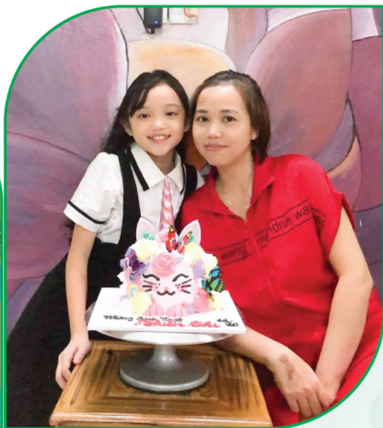
"Khi cuộc sống tạt cho mình một gáo nước lạnh, hãy tự nhủ rằng mình đỡ phí thời gian giặt áo quần".